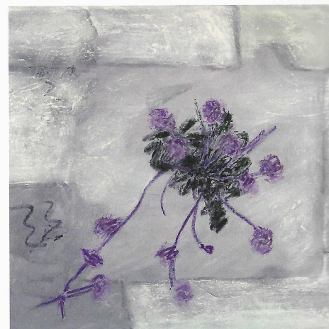
↑ Renée-Paule Danthine, (détail) technique mixte, 30 x 40 cm ©Les 3 Soleils

Il est impossible de parler du travail de Renée-Paule Danthine sans évoquer sa grande maîtrise de la couleur. Des techniques mixtes font merveille, huile, cire, pastels à